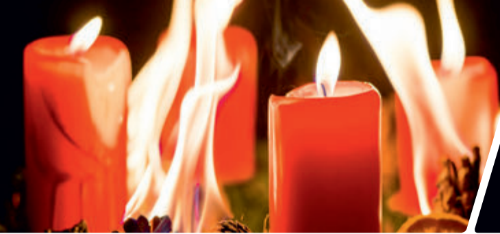
Abb. 1 Temperaturen einer Wachskerzenflamme